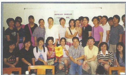
交流會來一個大合照。

(3) 探訪隊確能協助隊員發揮潛能，透過分享可舒緩壓力，更可透過參與訓練及參加小組來裝備自己，因此得到探訪隊組員的認同。