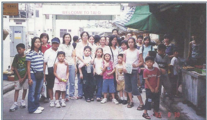
我們一齊去大嶼山宿營，仲去埋大澳啊！