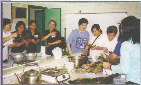
南亞裔婦女學習包粽。

的地區之一。從服務經驗中發現，區內南亞裔婦女大多不能以廣東話、甚或英語與本地人交往。由於溝通問題的存在，她們時常留在家中，較少出外和參加社區活動。