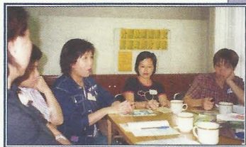
小組成員就房屋政策舉行分享會。

另一個重大的困難是婦女服務得不到政府資助，人力與財力資源較少。故此致力增加人力資源，培訓婦女成立互助支援網，以「助人自助」方式推展服務，有助減輕人手不足之壓力。而作為非資助團體，為減輕會方在服務方面之財政負擔，要不斷努力開拓資源，使不同的支援性小組可以在較充裕的條件下，為資源較貧乏的單親婦女提供價格相宜的服務。