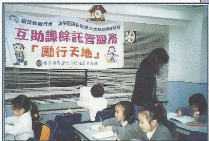
保母正在看管學童溫習。

(三) 保母們都是區內的居民，故此她們可以認識到居於附近的其他新來港家庭。在托管服務以外時間，如這些家庭臨時因事或工作而未能照顧子女時，保母們便能發揮互助精神，協助照顧這些學童，讓家長能安心外出。