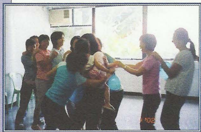
「同你做個Friend」社員交流營：樂暉社社員在遊戲中增強彼此之間的信任及合作性。

舊社員之間所建立的凝聚力，在協助新社員的適應上扮演著重要的角色。然而在新社員加入小組的初期，這股凝聚