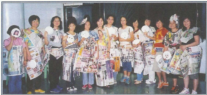
具創意的活動令會員發揮潛質。

士，如單親家長及其子女、長者、弱能人士等提供不同類型的服務，從而強化他們的個人成長及自我實踐。