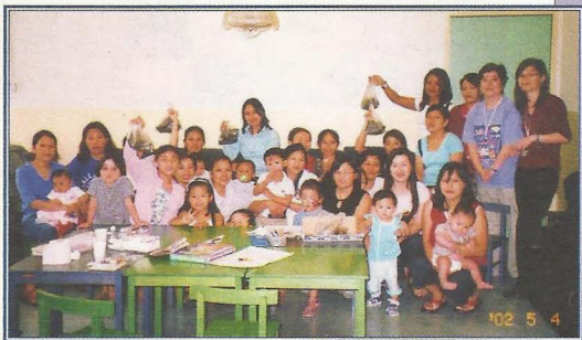
帶同小孩子一起參加聯誼活動。

(一) 參加廣東話學習小組後，南亞裔婦女能夠認識一些簡單的中文字，並運用學習過的廣東話與本地人作簡單會談，增強她們融入本地生活文化的能力。