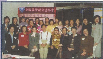
參加者舉行畢業禮，與本會董事、委員、義務律師等合照。

女身上，很少發展自我。在面對離婚時，便缺乏獨立自主的條件。在參與小組的過程中，鼓勵婦女裝備自強，透過進修提升自己，開拓新視野，積極為未來新生活鋪路。