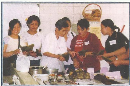
導師耐心教導學員。

此項計劃特為滿足區內南亞裔婦女的需要而設計，希望透過舉辦一連串的活動，包括：廣東話學習小組、社區資料介紹、參觀地區公共設施、與本地婦女交流聚會、參與義務工作以及聯誼活動等，幫助她們衝破障礙，逐漸適應生活，增加與本地居民的接觸及溝通，從而提升她們的潛能和自信心。此外，亦希望當她們感受到小組活動對她們的幫助後，會鼓勵更多有相同背景及需要的朋輩參加，彼