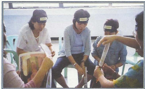
透過活動分享生活體驗，互相支持。

(四) 在義工訓練課程中，社員掌握了提供服務時應有的態度及技巧，及後並能積極地為有需要的人