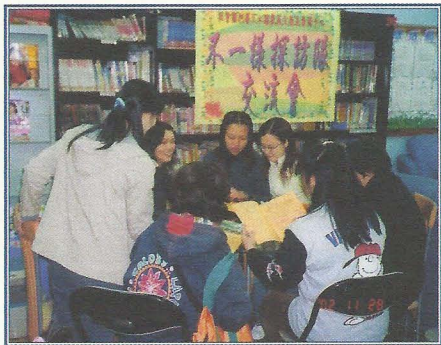
不一樣探訪隊交流會。

最重要的是，她們的背景及經歷相似，每每能夠透過經驗分享來協助對方解決困難，亦從而建立了互相支援的網絡，互相幫助。