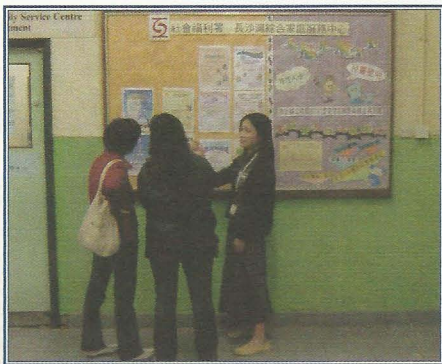
中心職員向她們介紹中心的服務。