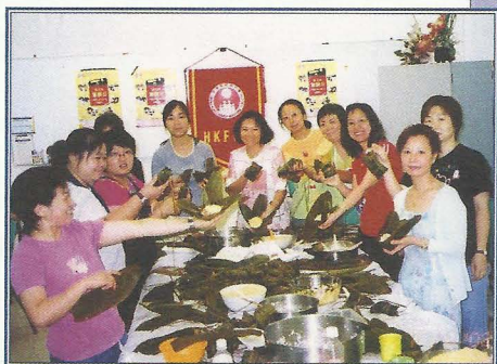
裹粽行動2002：在活動中，樂暉社社員擔任導師教授其他義工裹粽的技巧，為有需要的家庭在節日送上一份溫暖。

除了鼓勵社員間互相支持及關懷，小組在協助中心推行單親活動方面亦扮演著重要的角色，並為有需要的單親家長及其子女提供實際的支援，包括：護送、探訪、兒童託管、功課輔