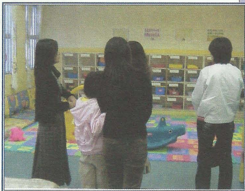
婦女組員參觀長沙灣綜合家庭服務中心的設施及服務。

的技巧、認識家庭暴力的成因及其對子女的影響、自我形象的提升、與子女的良好溝通、介紹社區資源等。此外，個案社工亦會跟進輔導個別組員，並且鼓勵組員互相關懷及支持。