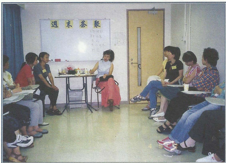
週末茶聚：服務使用者重聚。

我：廿年來熱線訓練了超過四百位朋輩義工輔導來電求助者，在協助超過 25,000 位求助者處理困難危機的同時，亦透過每月一次之熱線分享會及「在職」培訓，讓朋輩義工們能整合熱線助人的經驗，從而增強自信心及回饋社會的動力。由於熱線廿年來都是以同路人及婦女朋輩支援作為重點，故此很多曾求助的婦女都很想回饋，幫助其他曾像她們般無助的婦女，積極加入受訓。