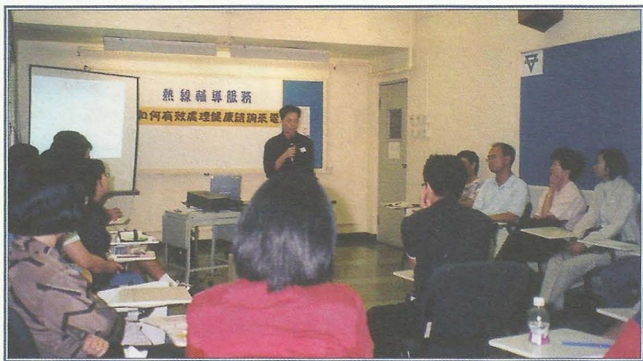
義工培訓課程為期半年。