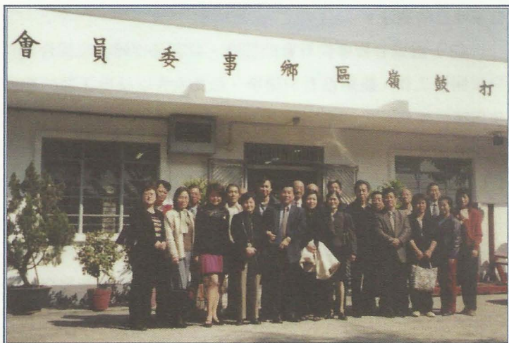
另一次地區探訪活動。