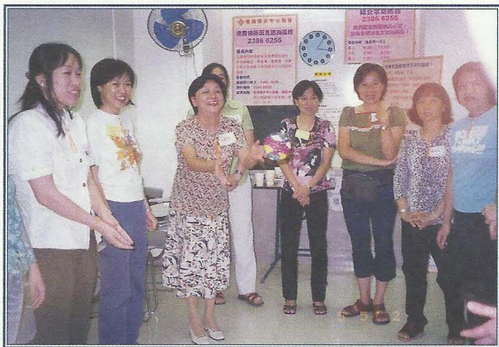
定期聚會分享生活經歷。

有激烈上升趨勢，在分享討論後，婦女朋輩與協會共同製作了一本名為「他為何包二奶」的小冊子，反省「包二奶」現象與傳統性別角色定型的關係，揭示女性在婚姻家庭問題中承擔的壓力，及探討「包二奶」問題的出路。