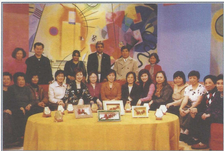
第二屆紅棉獎勵計劃得獎者到亞洲電視嘍嚶茶節目接受訪問。