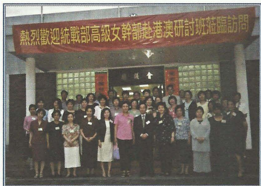
與國內婦女代表交流。

(二) 婦女實際接觸鄉務工作，自然需要學習有關工作的知識，其中甚至涉及一些比較深層次的法律知識，通過工作中的訓練，不斷提升她們的能力，有助個人發展。