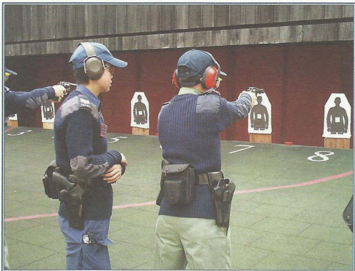
女警接受槍械訓練。