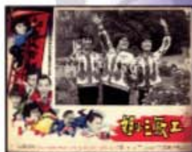
電影「工廠三小姐」廣告

到60年代，女性時興穿著喇叭褲。這種褲子取材自水手的工作服，是一種以緊貼臀部和大腿，而自膝蓋以下漸次張開的長褲。進入70年代初，喇叭褲被戲稱「掃地褲」，因為它褲腳闊達二十八吋，蓋過鞋面。