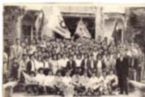
工廠女工參加工會旅行