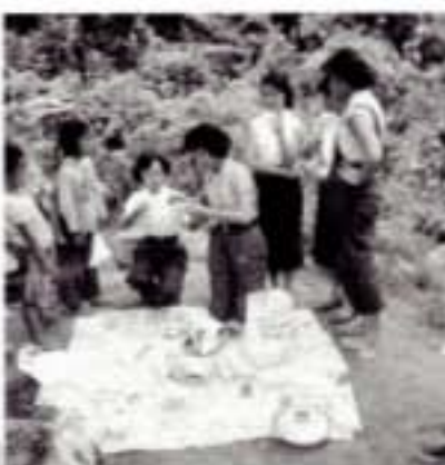
女工們於工餘時間結伴旅行