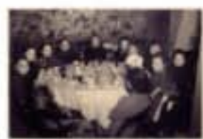
家人親友於餘閒時間一同聚餐

傘裙是50-60年代流行的女性服飾之一。傘裙多採用碎花或格仔圖案布料，分全身裙（上身貼身剪裁，中束腰帶，下身裙襠散開）及半身裙（上身配襯簡單外衣，加粗腰帶）。傘裙是當年從事文職工作女性的必備服飾。