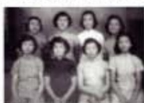
工廠女工們在影樓拍照

從獨立自主的「媽姐」，到經濟自主的工廠女工及白領，女性在參與有薪工作後，生活空間擴大了，閒暇消遣的選擇也多了：一般的活動包括縫紉、編織、手工藝，以及與工友聯袂郊遊、到影樓拍照、打麻雀、看大戲及看電影等，可見她們在工作和家庭生活之外，能享受生活的樂趣。