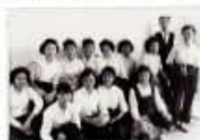
工廠女工與工友合照

旗袍是由清代滿族旗人婦女的長袍演變過來，故稱「旗袍」。在20世紀40-50年代，隨著旗袍裁縫師和穿著者南遷來港，旗袍風靡全港。仰慕時尚衣飾的女性，工餘也為自己一針一線縫製旗袍，一顯手藝。