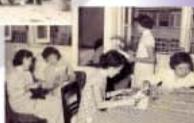
女工參與工餘活動