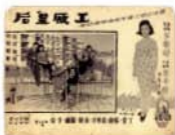
電影「工廠皇后」廣告

從獨立自主的「媽姐」，到經濟自主的工廠女工及白領，女性在參與有薪工作後，生活空間擴大了，閒暇消遣的選擇也多了：一般的活動包括縫紉、編織、手工藝，以及與工友聯袂郊遊、到影樓拍照、打麻雀、看大戲及看電影等，可見她們在工作和家庭生活之外，能享受生活的樂趣。