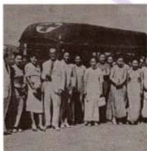
中國婦女會與印尼吧城中華婦女會聯合捐贈救護車給中國紅十字會(1939年)

在20世紀30年代中期，日本入侵中國，香港婦女團體一致支援抗日救國。當時不少女工、女學生、女教師和各界女性，紛紛加入籌募物資工作，並將募捐所得送往國內戰區，支援戰士。當時的主要統籌團體為香港婦女兵籌賑會。