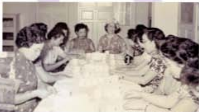
婦女參與社會服務