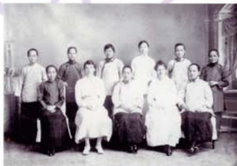
香港基督教女青年會為早期成立的婦女團體之一。 圖為其第一屆董事成員。

女性一直是社區工作的生力軍。透過不同的社區服務及活動，女性不但開闊個人生活領域，更為女性及社區有需要的社群提供服務，爭取合理權益，推進社會政策的制定及改善資源分配。