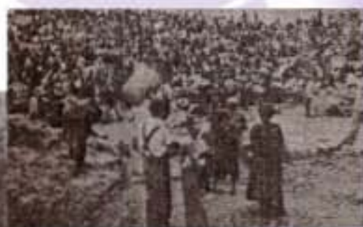
沙頭角賑助戰難同胞情形(1938年)

香港婦女兵籌賑會於1938年成立，早期的工作以救國救亡為重心。在1938至1941年期間，她們向中國紅十字會捐贈大批綿紗布及救護車；向香港學生賑濟會回國服務團提供大量綿花、藥紗布、綿襪、電單車；向石岐僑立醫院捐贈藥物及每月捐費二百元以救助傷民；舉行賣物遊藝會、慈善餐舞會、賣花籌款等活動作救賑之用；以及與香港四大婦女團體合辦兒童保育院。