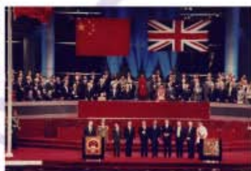
香港特別行政區成立

為迎接香港回歸祖國，由全港81個婦女團體組成的「香港婦女慶祝九七回歸籌備委員會」，於1996年至1997年間共舉行了六個全港性的跨年大型慶祝項目，包括在1996年舉行的「國慶文藝晚會」及「電車巡遊日」；以及1997年舉行的「喜迎回歸展英姿千人匯演」、「如何落實基本法」研討會、「香港婦女發展圖片展覽」及「萬家歡樂慶回歸」嘉年華會。