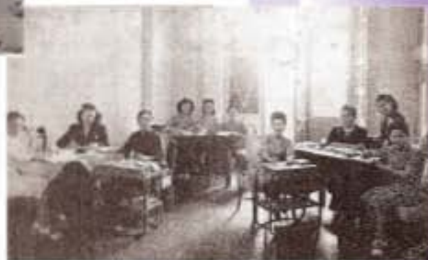
戰後復會，展開各項工作