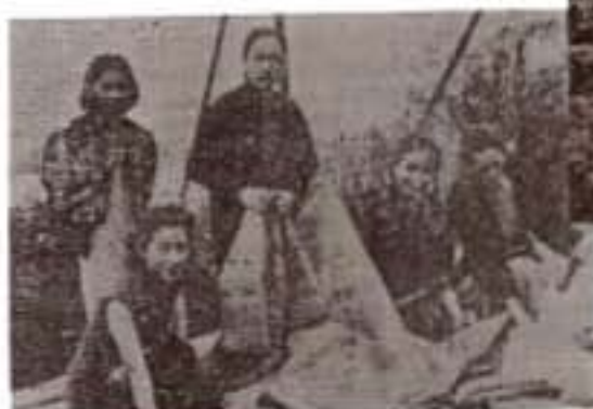
荔枝角醫院派發衣箱給傷兵情形(1938年)