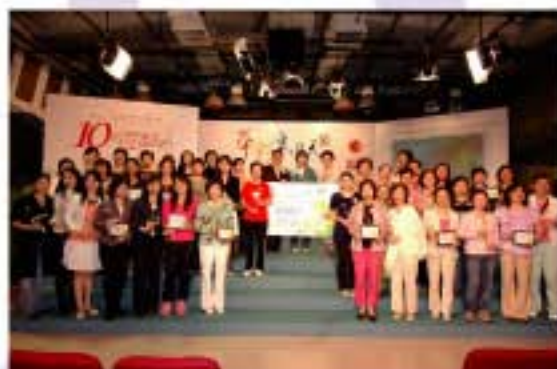
參與「華彩半邊天」電視特輯拍攝工作的 團體代表合照。