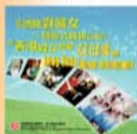
香港特區政府製作的《婦女公約》宣傳短片。