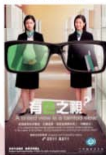
平等機會委員會宣傳海報 (2007年)