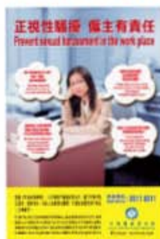
平等機會委員會宣傳海報 (2001年)