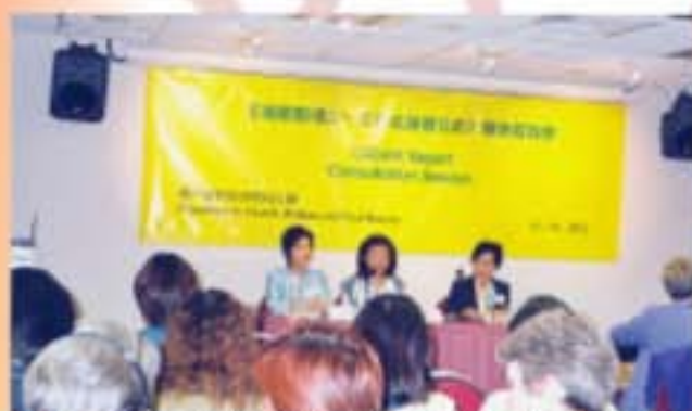
婦女事務委員會就擬備《婦女公約》報告舉行的公眾諮詢會。