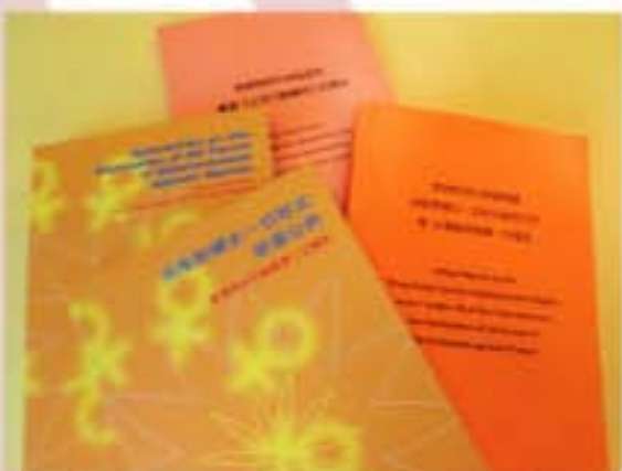
香港特區政府就《婦女公約》及《北京行動綱要》提交的報告。

香港特區就《婦女公約》提交的第一次報告和第二次報告，分別於1998年及2004年納入中國提交聯合國的報告內。聯合國消除對婦女歧視委員會於1999年及2006年審議了這兩份報告，對香港在推進婦女發展的工作表示肯定。